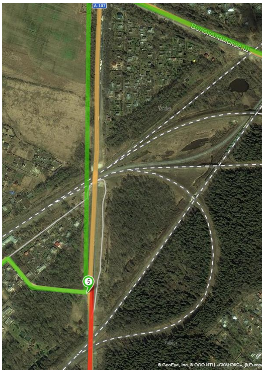
5 – это съезд с Бетонного Кольца. Указатель «Манихино-1»

Если едем по Новорижскому шоссе – то уходим на «бетонку» направо, если по «Волоколамке» – то налево. Объект находится между двумя этими трассами.